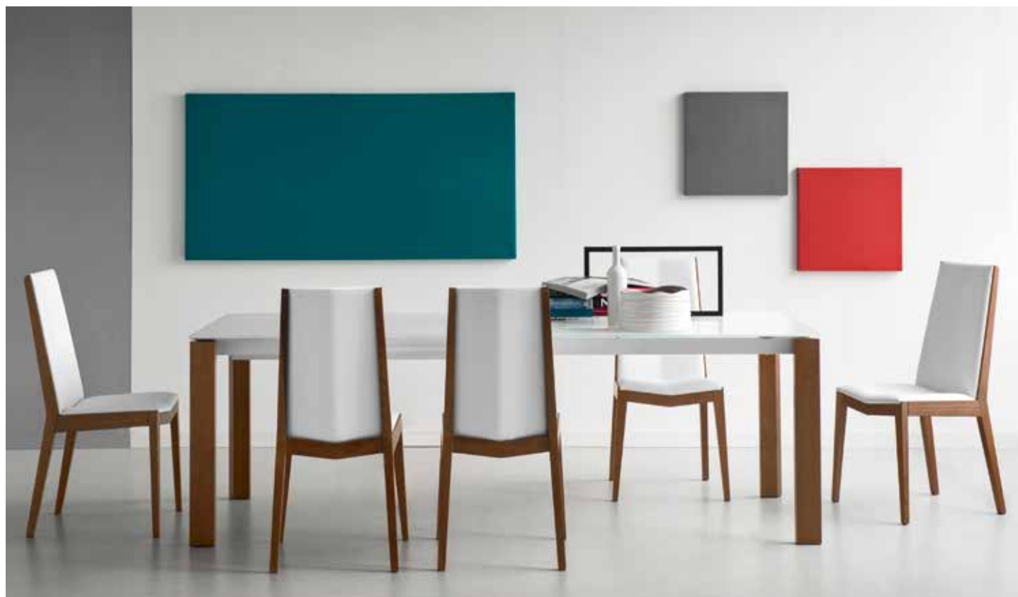
Table proposed in a wide selection of tops and legs. The tops are available in GEW extrawhite and GTA taupe colour glasses, or P10V Grey Oak melamine and P94 white laminate; all tops are available in size 130x90 and can support from 1 to 3 extensions of 50 cm each. The legs are offered in different finishes of solid beechwood: bleached beech P02, walnut P201, graphite P132, white lacquered P94 and taupe lacquered P176.

Tavolo disponibile in una vasta gamma di possibili abbinamenti. Piani proposti in vetro tortora GTA o extrawhite GEW, in Grey Oak P10V ed in laminato bianco P94, tutti disponibili in misura 130x90 o 160x90 a cui si possono aggiungere da 1 a 3 allunghe di 50 cm ciascuna. Gambe in faggio massello nelle finiture sbiancato P02, noce P201, grafite P132, laccato bianco P94 e laccato tortora P176.