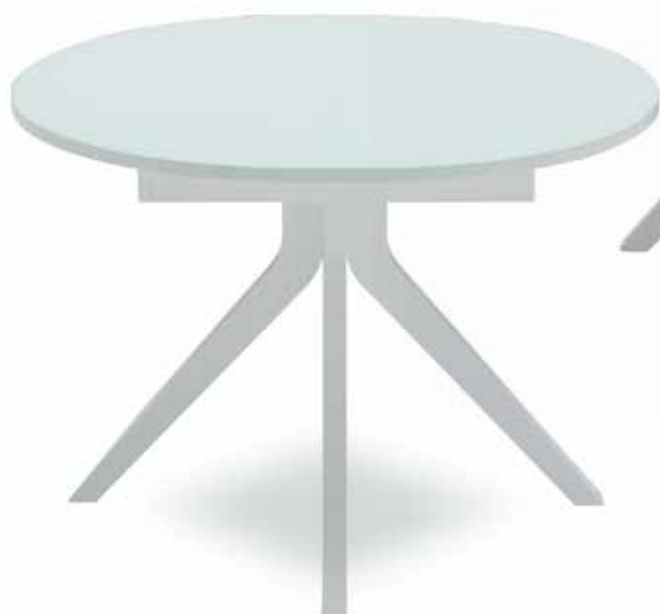
Table with solid beech-wood base, oval glass top size 110x100 cm extendable max 145 cm. Available in white or wengè finishes.

Tavolo con base centrale in faggio massello e piano ovale in vetro di 110x100 cm allungabile a 145 cm. Disponibile in bianco o wengè.