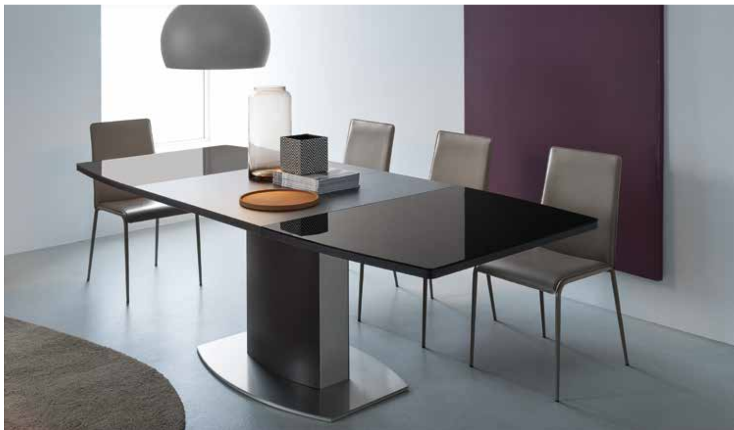
Table with central base, shaped glass top size 140x100 cm extendable max 230 cm with double-extensions located in the table base. Available in white and wenge finishes.

Tavolo con base centrale, piano sagomato in vetro di 140x100 cm allungabile a 230 cm tramite 2 allunghe in laminato contenute nella base del tavolo. Disponibile nelle finiture bianco e wengè.