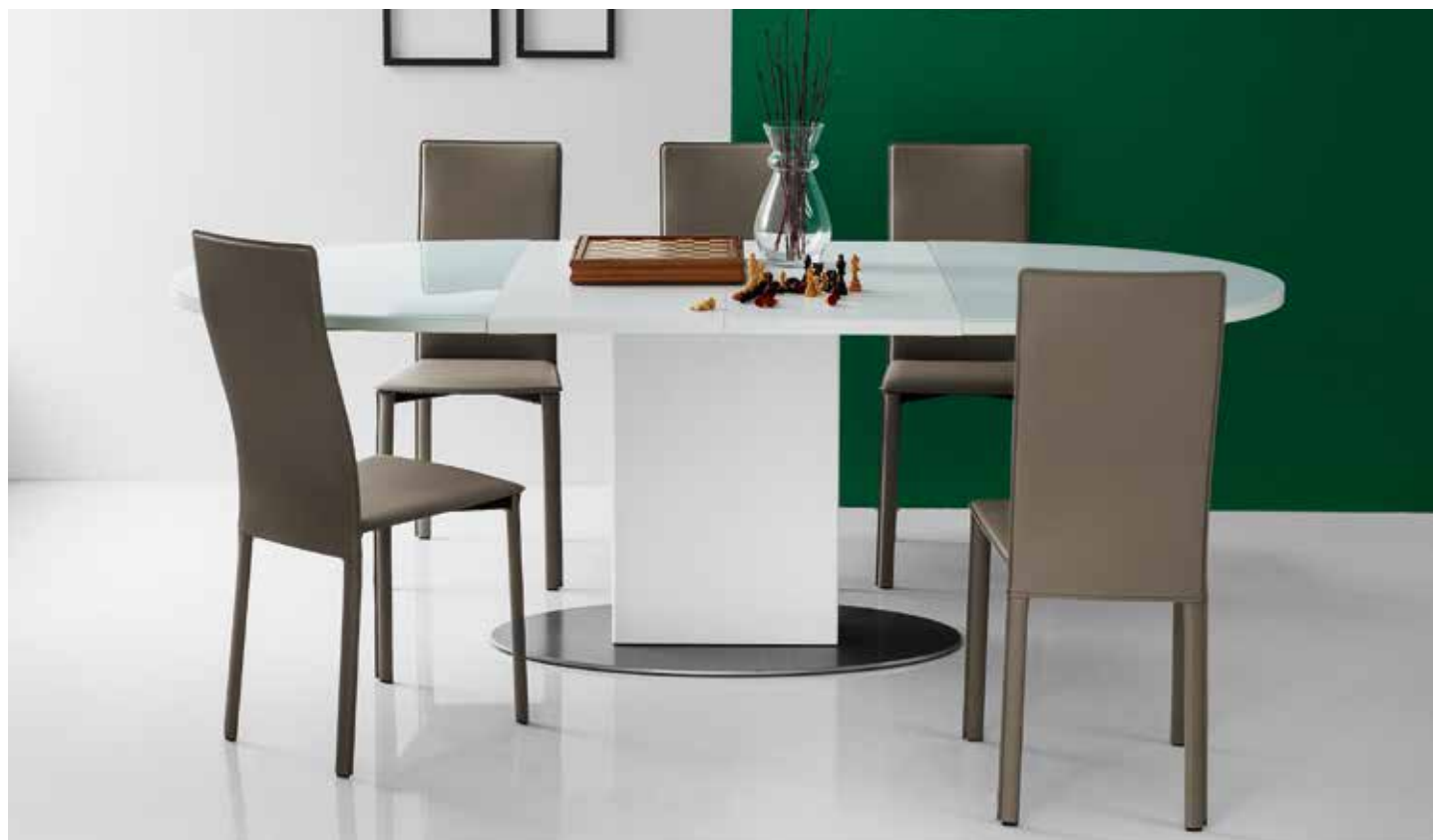
Table with central base, oval glass top size 140x100 cm extendable max 230 cm with double-extensions located in the table base. Available in white and wenge finishes.

Tavolo con base centrale, piano ovale in vetro 140x100 cm allungabile a 230 cm tramite 2 allunghe in laminato contenute nella base del tavolo. Disponibile nelle finiture bianco e wengè.