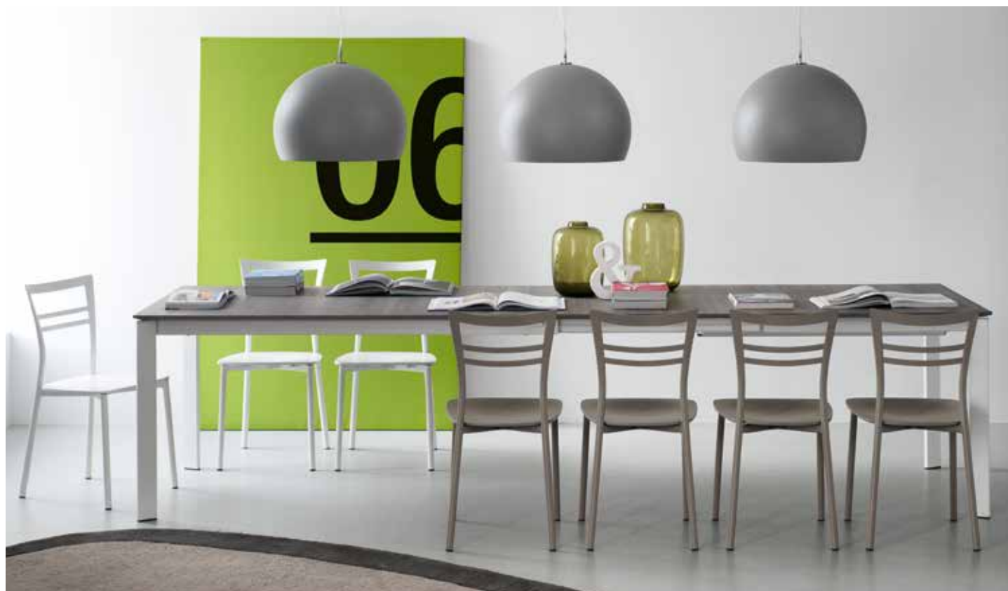
Table proposed in a wide selection of tops and legs. The tops are available in GEW extrawhite and GTA taupe colour glasses, or P10V Grey Oak melamine and P94 white laminate; all tops are available in size 130x90 and can support from 1 to 3 extensions of 50 cm each. The legs are offered in metal P95 satin steel or in P94 matt optic white.

Tavolo disponibile in una vasta gamma di possibili abbinamenti. Piani proposti in vetro tortora GTA o extrawhite GEW, in Grey Oak P10V ed in laminato bianco P94, tutti disponibili in misura 130x90 o 160x90 a cui si possono aggiungere da 1 a 3 allunghe di 50 cm ciascuna. Le gambe del tavolo sono in metallo verniciato bianco ottico opaco P94 oppure satinato P95.